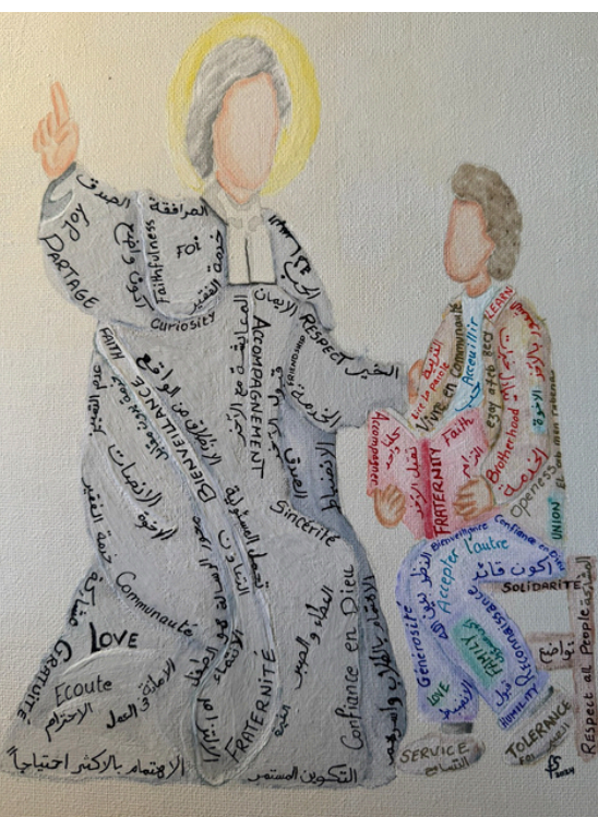
Souvenons-nous que nous sommes en la Sainte Présence de Dieu

Je conclue en affirmant que si j'ai prononcé aujourd'hui mon "OUI" au Seigneur, c'est grâce à vous tous. Je vous suis reconnaissant de donner du sens et de la valeur à ma vie. Priez pour moi !Vive Jésus dans nos cœurs, à jamais."